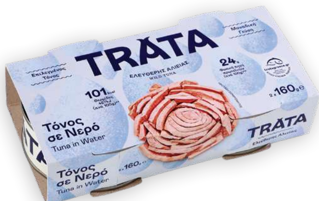
Τόνος σε νερό Tuna in water