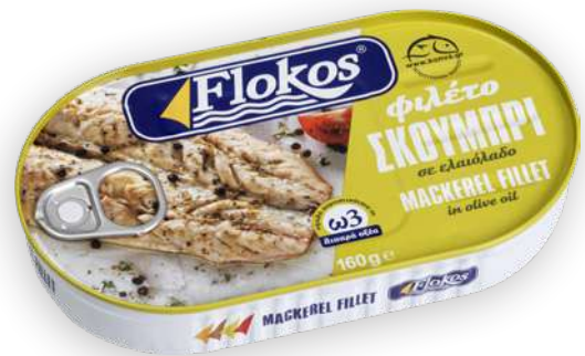
Φιλέτο σκουμπρί σε ελαιόλαδο Mackerel fillet in olive oil