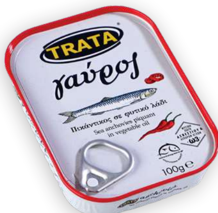
Γαύρος πικάντικος σε φυτικό λάδι Anchovies piquant in vegetable oil