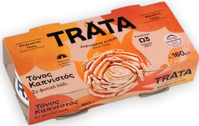
Τόνος καπνιστός Smoked tuna