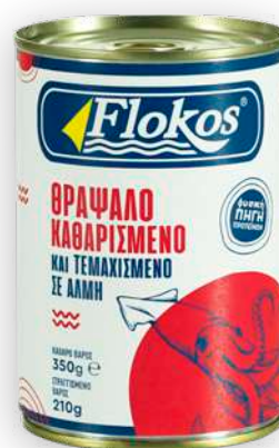
Θράψαλο καθαρισμένο και τεμαχισμένο σε άλμη Sliced squid in brine