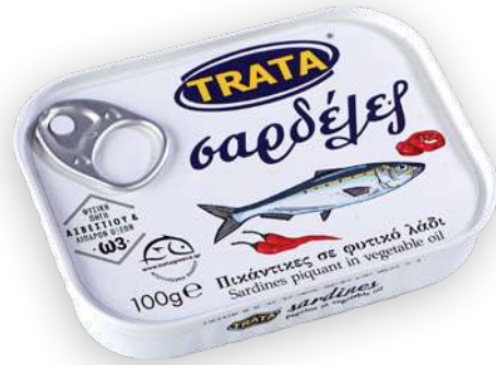
Σαρδέλες πικάντικες σε φυτικό λάδι Sardines piquant in vegetable oil