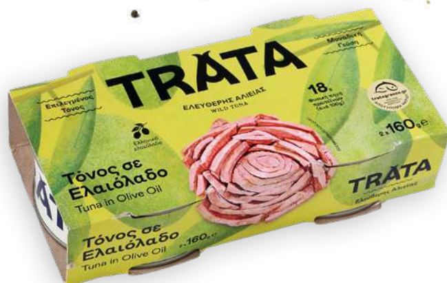
Τόνος σε ελαιόλαδο Tuna in olive oil