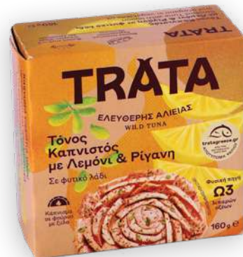
Τόνος καπνιστός με λεμόνι και ρίγανη Smoked tuna with lemon and oregano