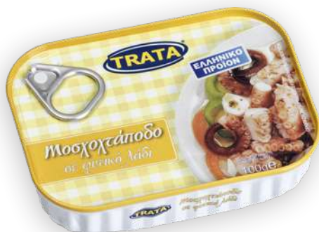
Μοσχοχτάποδο σε φυτικό λάδι Musky octopus in vegetable oil