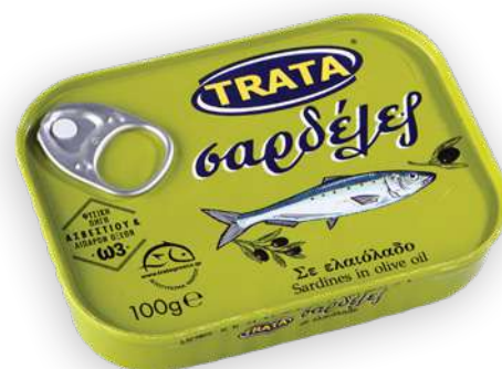
Σαρδέλες σε ελαιόλαδο Sardines in olive oil