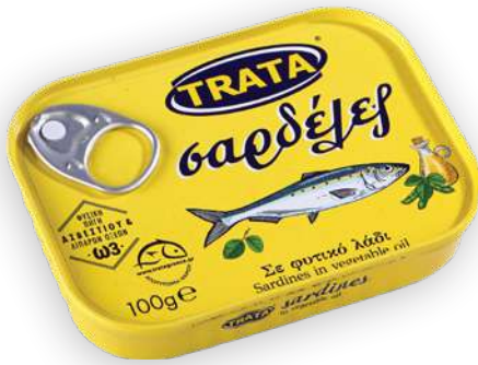
Σαρδέλες σε φυτικό λάδι Sardines in vegetable oil