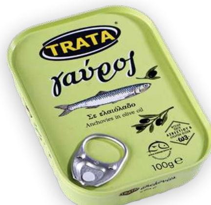
Γαύρος σε ελαιόλαδο Anchovies in olive oil