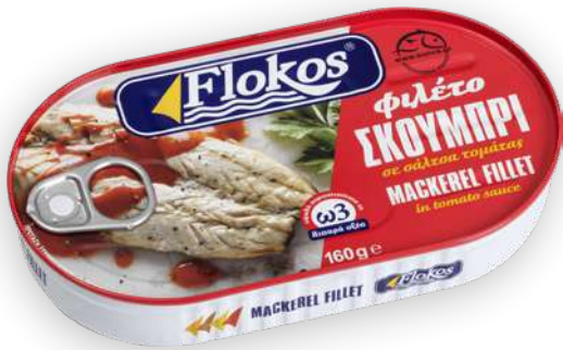
Φιλέτο σκουμπρί σε σάλτσα τομάτας Mackerel fillet in tomato sauce