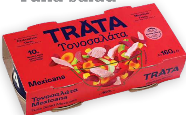
Τονοσαλάτα Mexicana Tuna salad Mexicana