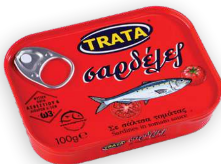
Σαρδέλες σε σάλτσα τομάτας Sardines in tomato sauce