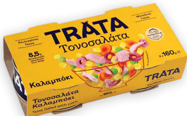
Τονοσαλάτα καλαμπόκι Tuna salad with corn