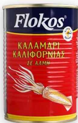
Καλαμάρι Καλιφόρνιας σε άλμη Californian squid in brine