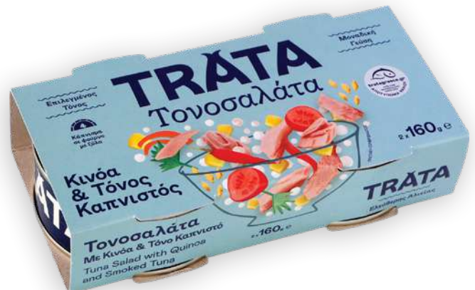
Τονοσαλάτα με κινόα και τόνο καπνιστό Tuna salad with quinoa and smoked tuna