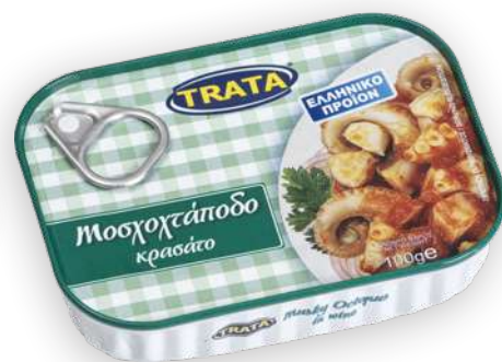
Μοσχοχτάποδο κρασάτο Musky octopus in wine