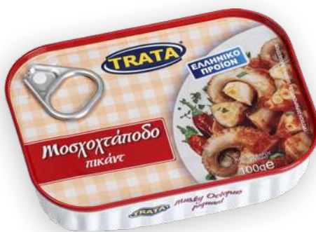
Μοσχοχτάποδο πικάντ Musky octopus piquant