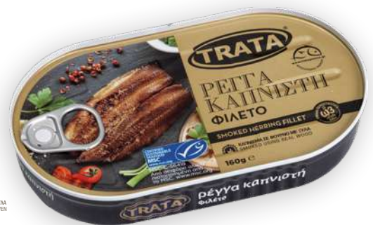
Ρέγγα καπνιστή φιλέτο Smoked herring fillet