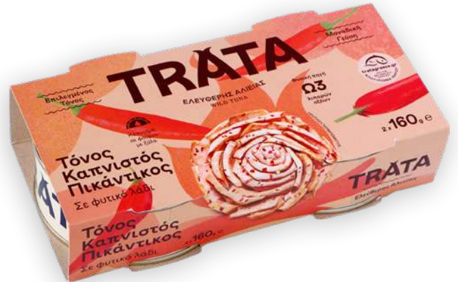
Τόνος καπνιστός πικάντικος Smoked tuna piquant