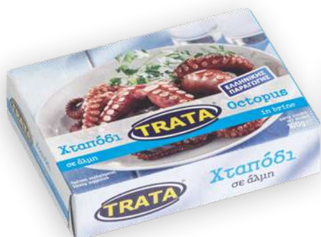
Χταπόδι σε φυσικό χυμό Octopus in natural juice