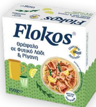
Θράψαλο σε φυτικό λάδι και ρίγανη Squids in vegetable oil and oregano