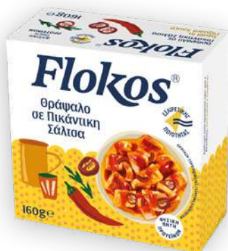
Θράψαλο σε πικάντικη σάλτσα Squids in piquant sauce