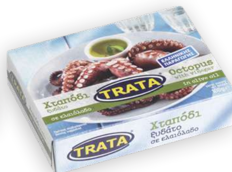
Χταπόδι ξυδάτο σε ελαιόλαδο Octopus with vinegar in olive oil