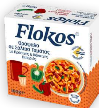
Θράψαλο σε σάλτσα τομάτας, με πράσινες και κόκκινες πιπεριές Squids in tomato sauce, with green and red peppers