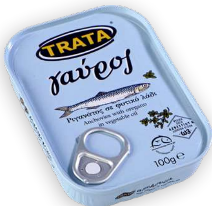
Γαύρος ριγανάτος σε φυτικό λάδι Anchovies with oregano in vegetable oil