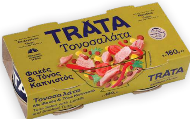
Τονοσαλάτα με φακές και τόνο καπνιστό Tuna salad with lentils and smoked tuna