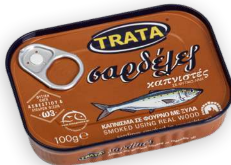
Σαρδέλες καπνιστές σε φυτικό λάδι Sardines smoked in vegetable oil