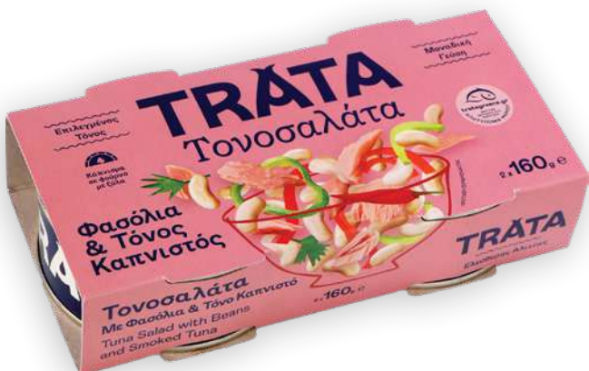
Τονοσαλάτα με φασόλια και τόνο καπνιστό Tuna salad with beans and smoked tuna