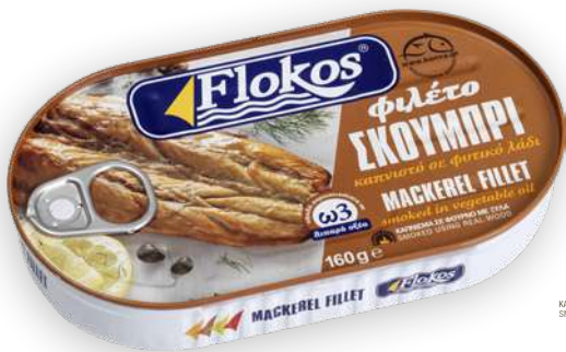
Φιλέτο σκουμπρί καπνιστό σε φυτικό λάδι Mackerel smoked fillet in vegetable oil