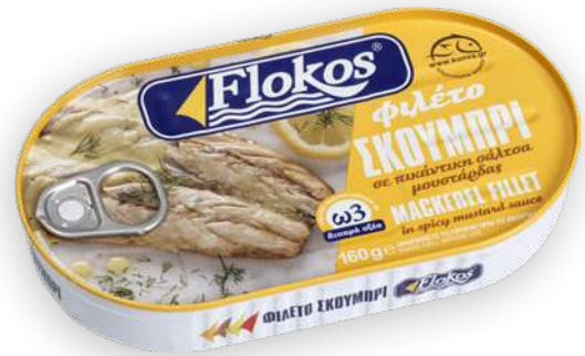
Φιλέτο σκουμπρί σε πικάντικη σάλτσα μουστάρδας Mackerel fillet in spicy mustard sauce