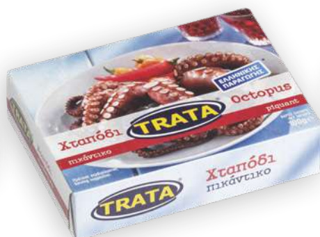
Χταπόδι πικάντικο Octopus piquant